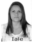
117-Iale Partido 1 SE - SERGIPE