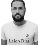
116-Laion Dias Partido 1 SE - SERGIPE